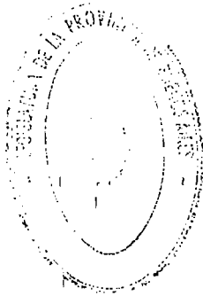
Ing. FELIPE C. SOLÁ PRESIDENTE HONORABLE SENADO PROV. BUENOS AIRES