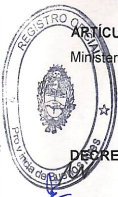
DANIEL OSVALDO SCIOLI Governador de la Provincia de Buenos Aires