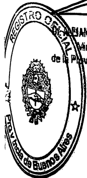
DANIEL OSVALDO SCIOLI Gobernador de la Provincia de Buenos Aires