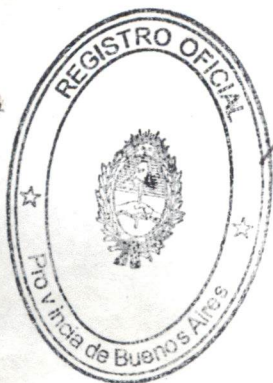
DANIEL OSVALDO SCIOLI Governador de la Provincia de Buenos Aires