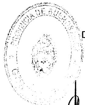
GERARDO ADRIAN OTERO Ministro de Economía de la Provincia de Buenos Aires